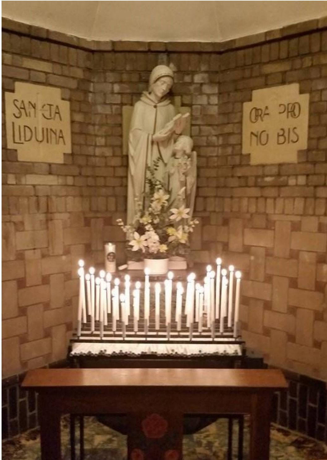
Liduina-nis, onderdeel van onze Dagkapel.